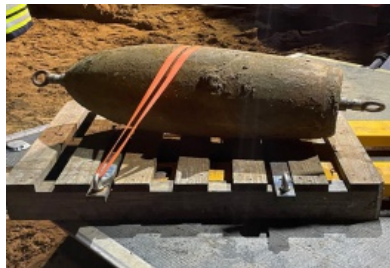
Weltkriegsbombe im Elsdorfer Gewerbegebiet erfolgreich entschärft