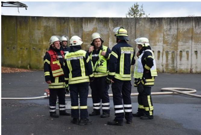
Rettungsdienst waren eine Rettungswagen sowie ein Rettungswagen der SEG-Rettung

Rotenburg vor Ort. Das Ordnungsamt und der Samtgemeindebürgermeister waren ebenfalls vor Ort. Über 100 Einsatzkräfte waren an diesem Einsatz beteiligt.