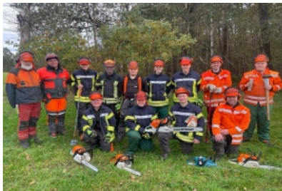
Sägelehrgang bei der Feuerwehr Sittensen