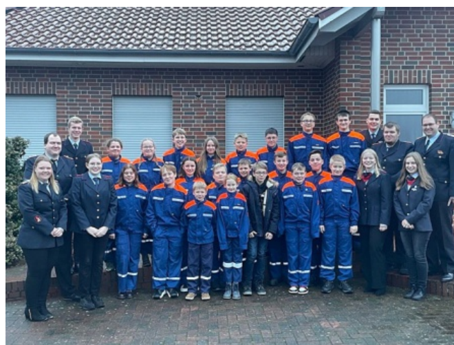
Alle Jugendliche die an der Versammlung teilgenommen haben mit Ihren Betreuern.