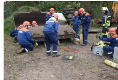
24 Stunden Dienst bei der Jugendfeuerwehr Selsingen