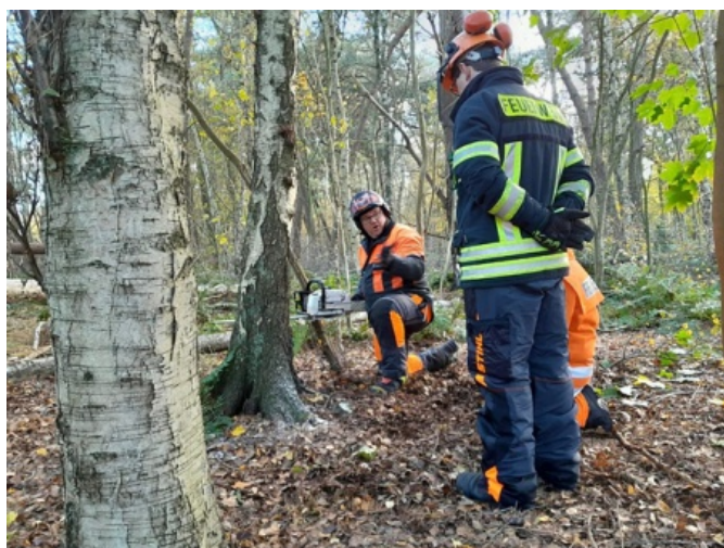
Den Teilnehmern wird das fachgerechte Fällen eines Baumes gezeigt.

Vom 30. Oktober bis zum 4. November absolvierten elf Feuerwehrlaute der Sittenser Feuerwehr den Motorsägen-Lehrgang. An zwei Abenden und einem Samstag wurde die fachgerechte Arbeitsweise gemäß den Unfallverhütungsvorschriften, feuerwehrspezifische Anforderungen und für die Arbeit mit der Motorsäge erforderliche persönliche Schutzausrüstung sowohl in der Theorie als auch in der Praxis behandelt.