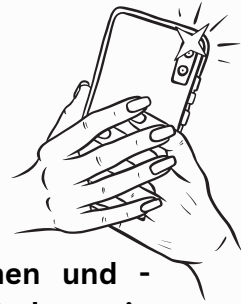
Foto machen, markieren, gewinnen! Neuer Feuerwehr-Foto-Point bei Color Line

Der Feuerwehr-Foto-Point am Color Line-Terminal ist da! Feuerwehrkameradinnen und -kameraden sind eingeladen, ihre Mini-Kreuzfahrt unvergesslich zu machen, indem sie Erinnerungsfotos am neuen Feuerwehr-Foto-Rahmen des Landesfeuerwehrverbandes schießen.