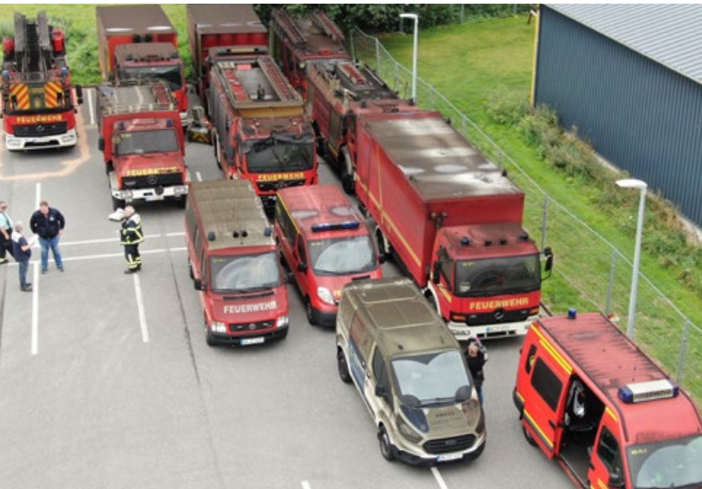
Der Fuhrpark der FF Oldenburg ist derzeit nicht einsatzklar.

Am Dienstagmorgen (14.9.) kam es aus noch ungeklärter Ursache zu einem Feuer im Gerätehaus der Freiwilligen Feuerwehr Oldenburg / H. in der Ringstraße. Die Feuerwehr musste auf die Hilfe anderer Feuerwehren warten, da die komplette Halle stark verqualmt war und auch an einer Stelle Feuer zu sehen war. Ein Fahrzeug brannte komplett aus, alle anderen Fahrzeuge konnten zwar aus der Halle gefahren werden, sind aber nicht mehr einsatzbereit. Die Polizei ermittelt nun die genaue Brandursache.