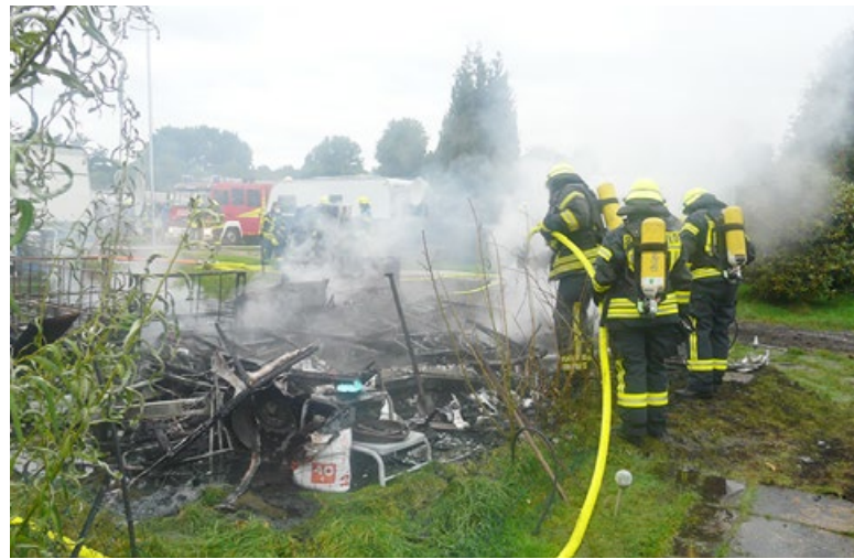
Auf dem Campingplatz am Bornhöveder See brannte ein Wohnwagen.