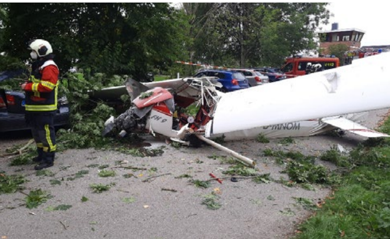
Schwer verletzt wurde der Pilot dieses Ultraleichtflugzeuges beim Crash in Heist.

Am Donnerstagnachmittag (9.9.) wurden die Feuerwehr Heist und Feuerwehr Moorrege zu einem Flugunfall mit einem Luftfahrzeug auf den Flugplatz Heist gerufen. Ein Ultraleichtflugzeug stürzte im Bereich des Flugplatzes ab und beschädigte dabei auch parkende PKW.