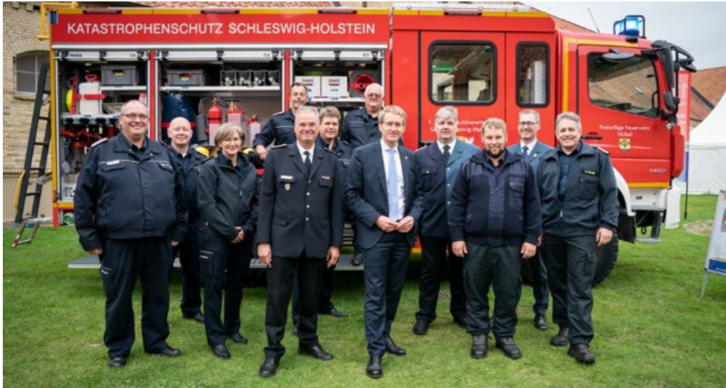
Ministerpräsident Daniel Günther am Stand des LFV SH beim Landesgeburtstag.

75 Jahre jung ist unser schönes Schleswig-Holstein im August geworden. Grund genug für ein großes Bürgerfest auf der Schlossinsel am Schloss Gottorf in Schleswig.