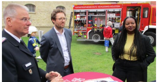
Politische Gespräche am Stand des LFV SH.