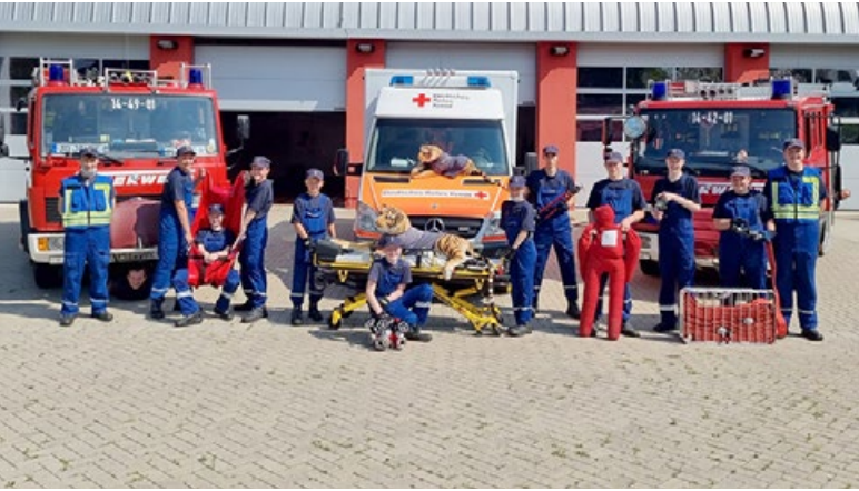
Endlich mal wieder treffen. Freude bei den Jugendlichen im Kreis Pinneberg.

Beim ersten Aktionstag der KfV Pinneberg haben 220 Jugendliche aus 18 Jugendfeuerwehren teilgenommen!