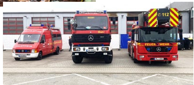
Mit einem geliehenen Löschzug konnte die FF Oldenburg zwei Tage später wieder in den Einsatz gehen.

Zur Ursache und Schadenshöhe gibt es noch keine Angaben. Ob die durch Brandrauch stark kontaminierten Fahrzeuge mitsamt derer sensibler Elektronik reparabel sind, klären nun Sachverständige. Ein HLF brannte total aus. Auch die Stahlskelettkonstruktion der ausgebrannten Fahrzeughalle wird nun von Statikern überprüft.