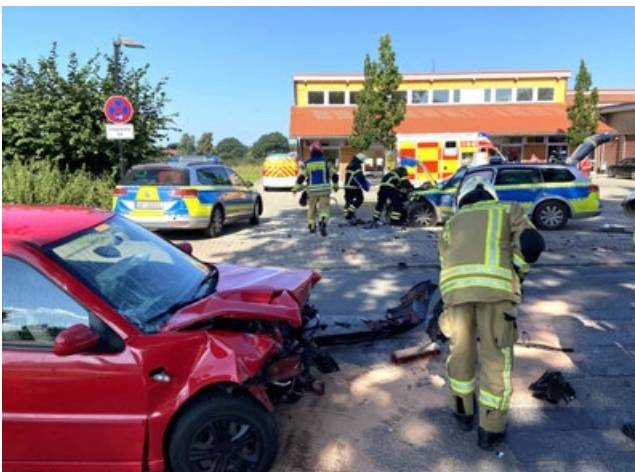
Eine Feuerwehrfrau und zwei Polizisten wurden bei diesem Weegeunfall verletzt.

Direkt vor der Feuerwache in Hoisdorf sind ein VW Polo und ein Streifenwagen der Polizei zusammengestoßen. Der Streifenwagen war mit Blaulicht unterwegs zu einem gemeldeten Schuppenbrand, eine junge Feuerwehrfrau war aus diesem Grund mit ihrem privaten PKW auf der Anfahrt zum Gerätehaus.