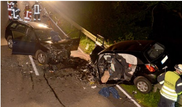
Ein Todesopfer forderte dieser Unfall bei Ascheffel.

Am Sonntagabend (19.9.) sind gegen 20.45 auf der L265 in Höhe Holzkoppel zwei Fahrzeuge frontal kollidiert. Beim Eintreffen der Rettungskräfte waren die Insassen eines der Fahrzeuge noch eingeklemmt, das Auto war auf der Leitplanke zum Stehen gekommen.