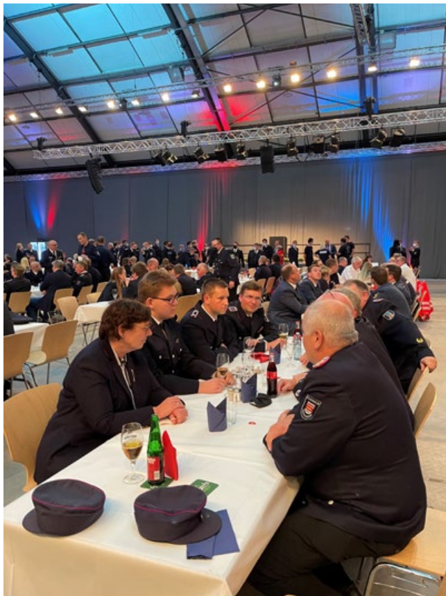
Innenministerin Sütterlin-Waack besuchte beim Helferfest in Neumünster jeden Tisch und suchte die Gespräche mit den Kameraden.

Als Dank für ihren Einsatz während der Hochwasserkatastrophe in Rheinland-Pfalz hat die Landesregierung alle Einsatzkräfte von Hilfeleistungsorganisationen, Feuerwehren, des technischen Hilfswerks sowie des Katastrophenschutzes und der psychosozialen Notfallvorsorge zu einer festlichen Veranstaltung in die Holstenhallen in Neumünster eingeladen.